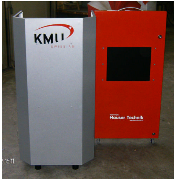
Fahrbares Rednerpult mit eingebautem Bildschirm