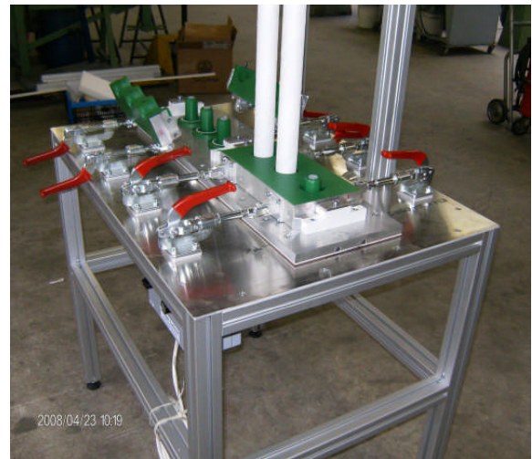
Tisch aus Aluprofil mit Heizung und Giessformen