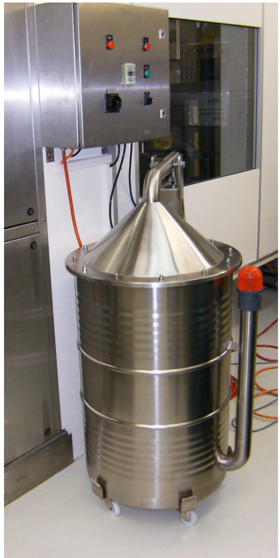
Fasskühlstation, Deckel mit Pneumatikzylinder anhebbar