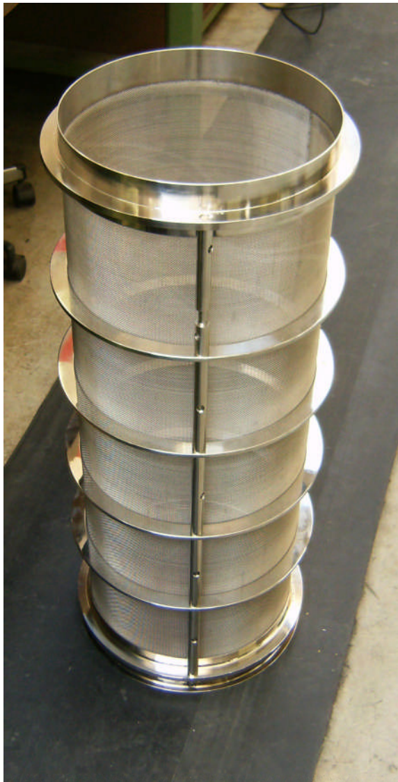
Siebkorb zu Siebmaschine ohne inneren Absatz mit Sieb aus Stahl rostfrei oder Nylon